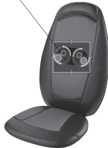
Mecanismo en movimiento para el masaje Shiatsu

Los materiales y telas reales del producto pueden variar de los que se muestran en la imagen.