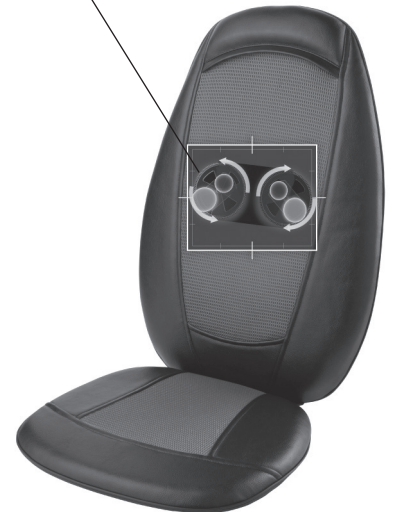
The actual product materials and fabrics may vary from the picture shown.