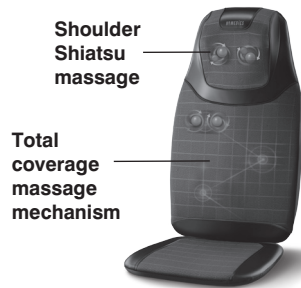
The actual product materials and fabrics may vary from the picture shown.